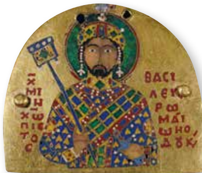
VII. Dukasz Mihály császár