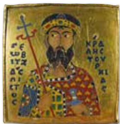
I. Géza magyar király

kétoldalt fia, Konsztantinosz, és I. Géza magyar király (1074–1077) jelenik meg. A képek a Keletrómai Birodalom kedvelt ötvöstechnikájával, rekeszzománc-eljárással készültek. A korona vizsgálata során megállapították, hogy Mihály császár lemezét rendellenesen erősítették a helyére, így valószínű, hogy eredetileg nem az ő képe volt a foglalatban. Az abroncs felső peremén, a korona előoldalán oromdíszlemezek láthatóak, melyek szimmetrikusan, a két oldal felé fokozatosan kisebbednek. Az oromdíszek csúcsát ametisztkövek díszítik, míg a lemezek ún. azsúrzománc-eljárással